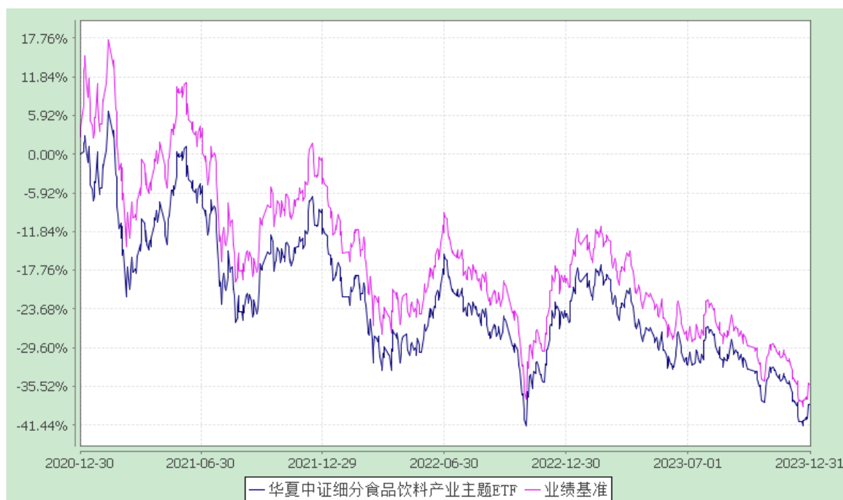
华夏中证细分食品饮料产业主题交易型开放式指数证券投资基金 份额累计净值增长率与业绩比较基准收益率历史走势对比图 (2020 年 12 月 30 日至 2023 年 12 月 31 日)