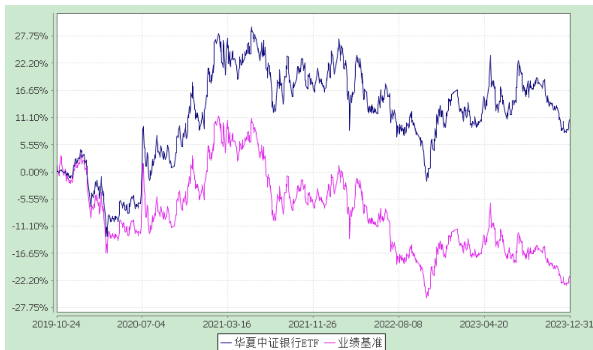
华夏中证银行交易型开放式指数证券投资基金 份额累计净值增长率与业绩比较基准收益率历史走势对比图 (2019年10月24日至2023年12月31日)