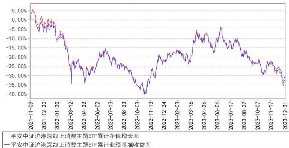
平安中证沪港深线上消费主题ETF累计净值增长率与同期业绩比较基准收益率的历史走势对比图