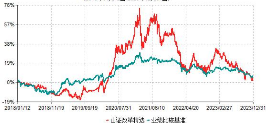
山西证券改革精选灵活配置混合型证券投资基金累计净值增长率与业绩比较基准收益率历史 走势对比图 (2018年01月12日-2023年12月31日)

按照本基金的基金合同规定，自基金合同生效之日起6个月内使基金的投资组合比例符合本基金合同的有关约定。建仓期结束时各项资产配置比例符合基金合同的有关约定。