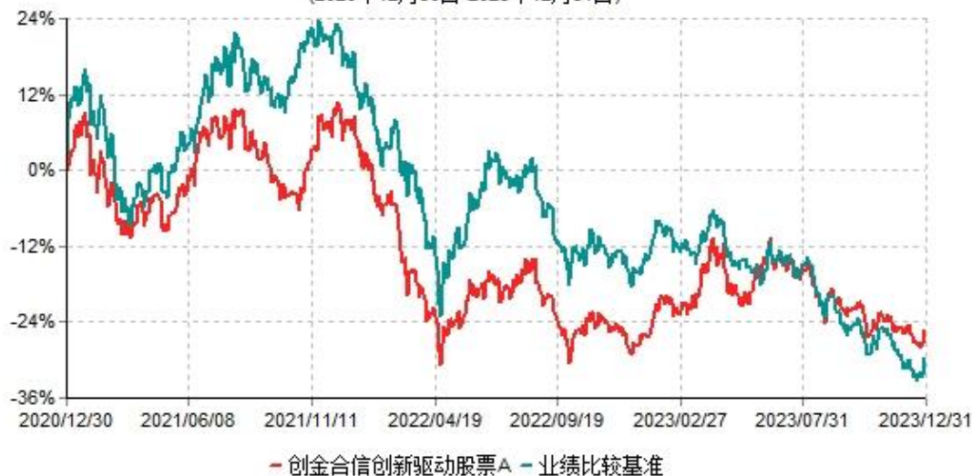
创金合信创新驱动股票A累计净值增长率与业绩比较基准收益率历史走势对比图 (2020年12月30日-2023年12月31日)