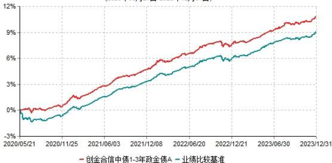
创金合信中债1-3年政金债A累计净值增长率与业绩比较基准收益率历史走势对比图 (2020年05月21日-2023年12月31日)