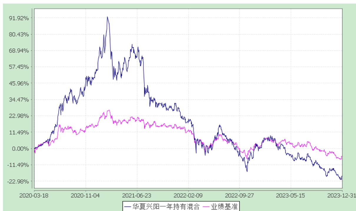
华夏兴阳一年持有期混合型证券投资基金 份额累计净值增长率与业绩比较基准收益率历史走势对比图 (2020年3月18日至2023年12月31日)