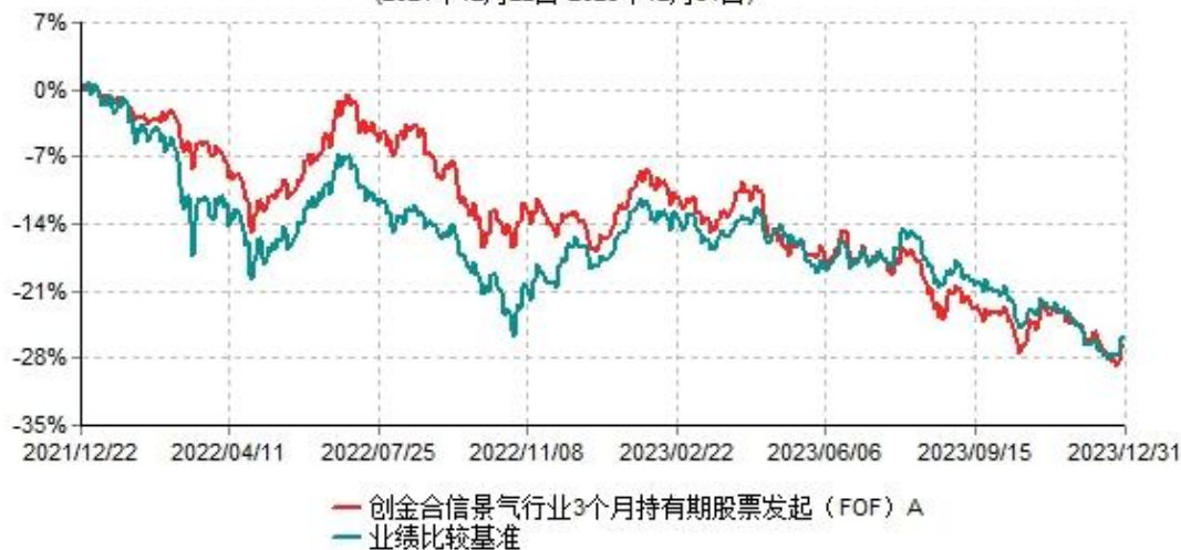
创金合信景气行业3个月持有期股票发起（FOF）A累计净值增长率与业绩比较基准收益率历史走势对比图 (2021年12月22日-2023年12月31日)