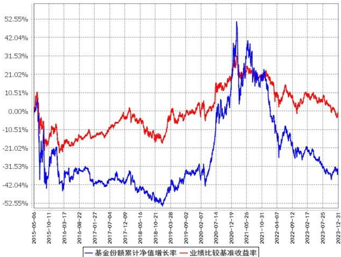
基金份额累计净值增长率与同期业绩比较基准收益率的历史走势对比图 (2015年5月6日至2023年12月31日)