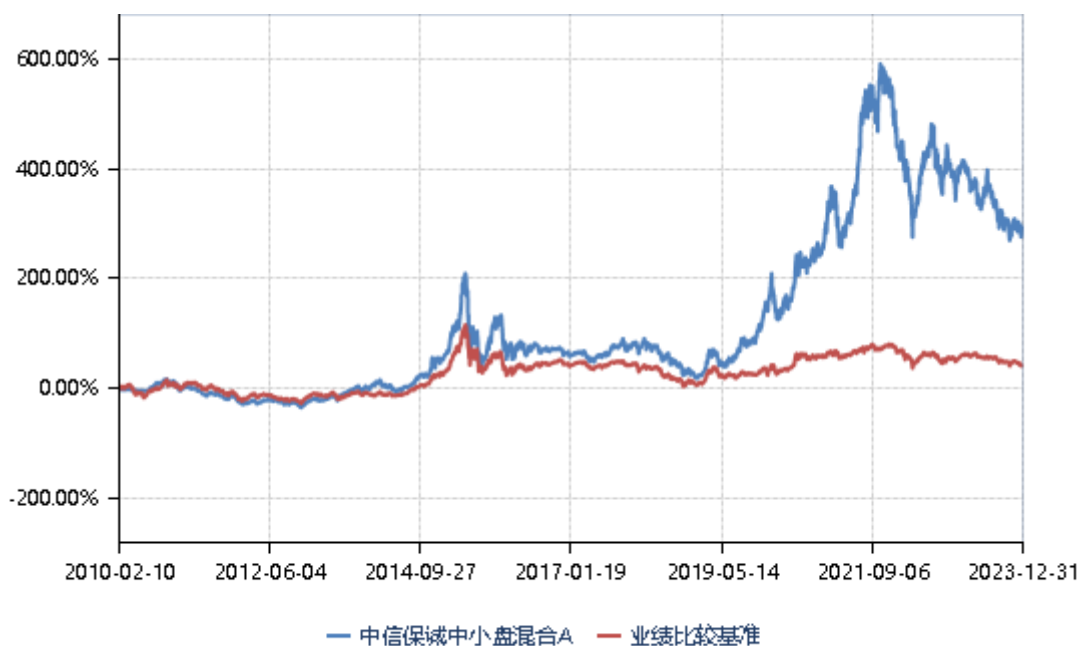
中信保诚中小盘混合 C