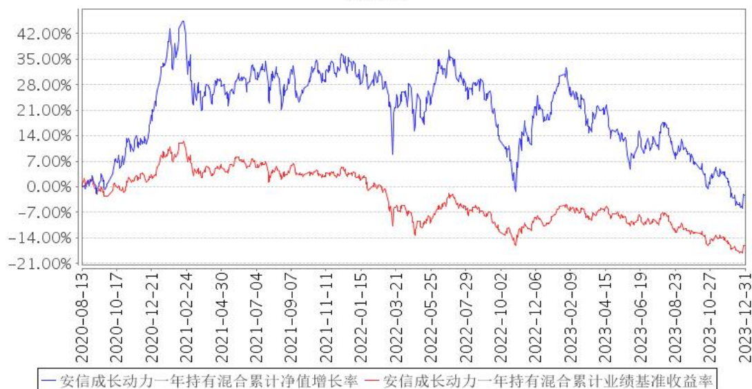
安信成长动力一年持有混合累计净值增长率与同期业绩比较基准收益率的历史走势对比图