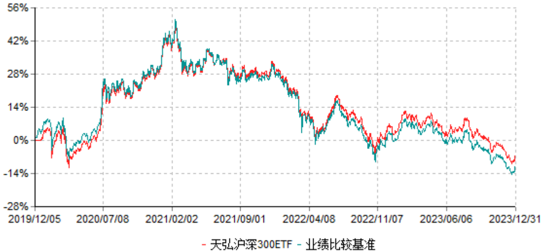
天弘沪深300交易型开放式指数证券投资基金累计净值增长率与业绩比较基准收益率历史走势对比图 (2019年12月05日-2023年12月31日)