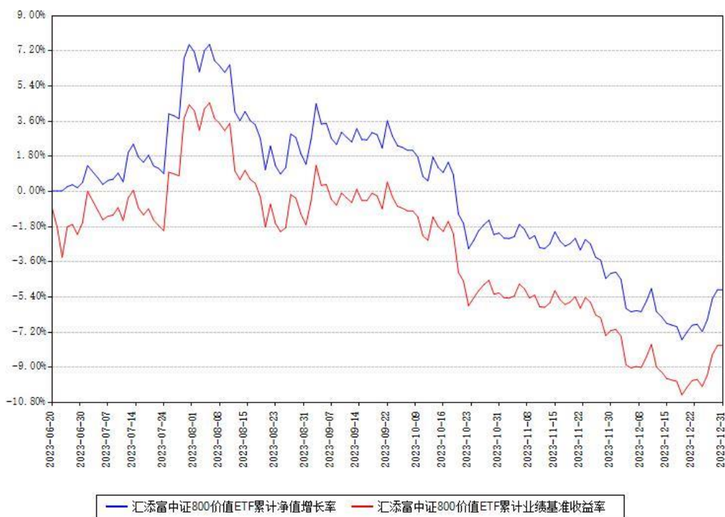
汇添富中证800价值ETF累计净值增长率与同期业绩基准收益率对比图

注：本《基金合同》生效之日为2023年06月20日，截至本报告期末，基金成立未满一年。本基金建仓期为本《基金合同》生效之日起6个月，截至本报告期末，本基金已完成建仓，建仓期结束时各项资产配置比例符合合同约定。