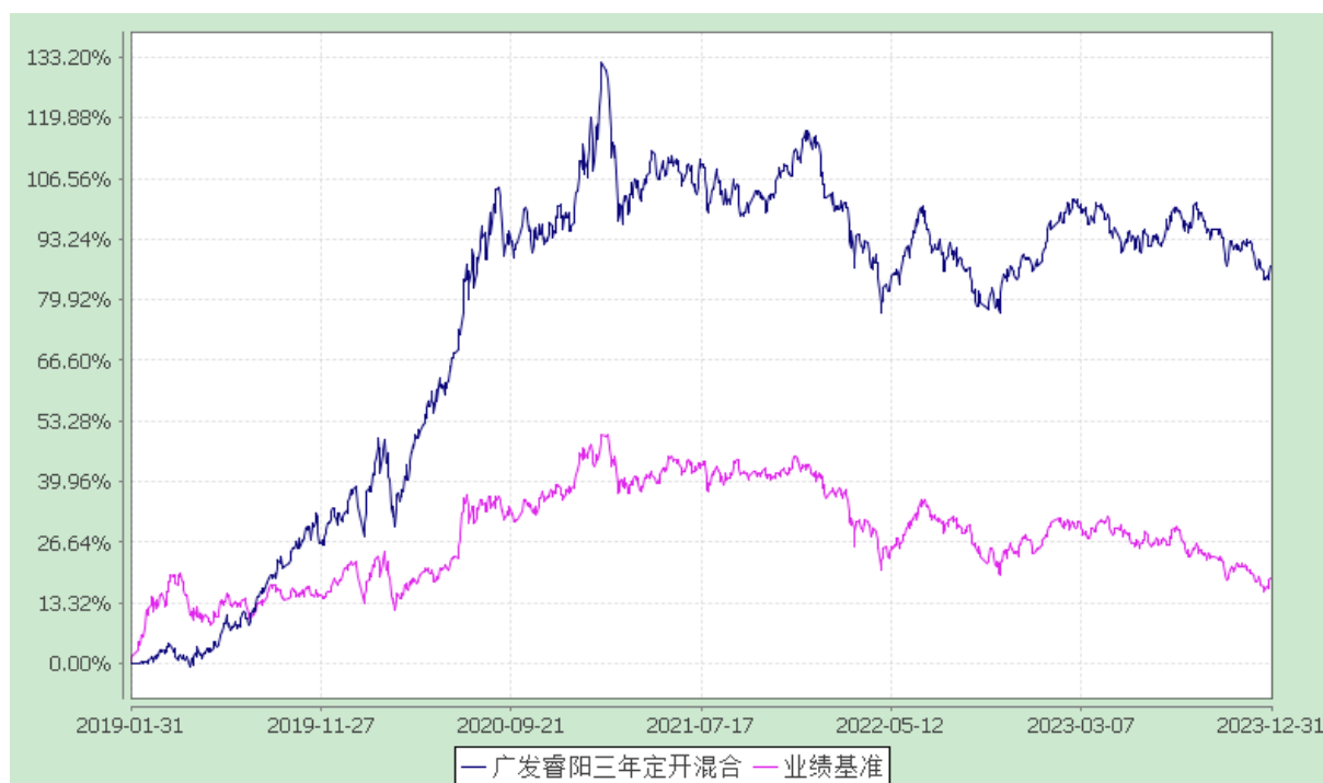
广发睿阳三年定期开放混合型证券投资基金 份额累计净值增长率与业绩比较基准收益率的历史走势对比图 (2019 年 1 月 31 日至 2023 年 12 月 31 日)