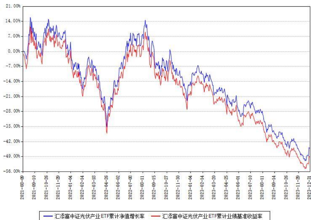
汇添富中证光伏产业ETF累计净值增长率与同期业绩比较基准收益率对比图

注：本基金建仓期为本《基金合同》生效之日（2021年08月09日）起6个月，建仓期结束时各项资产配置比例符合合同约定。