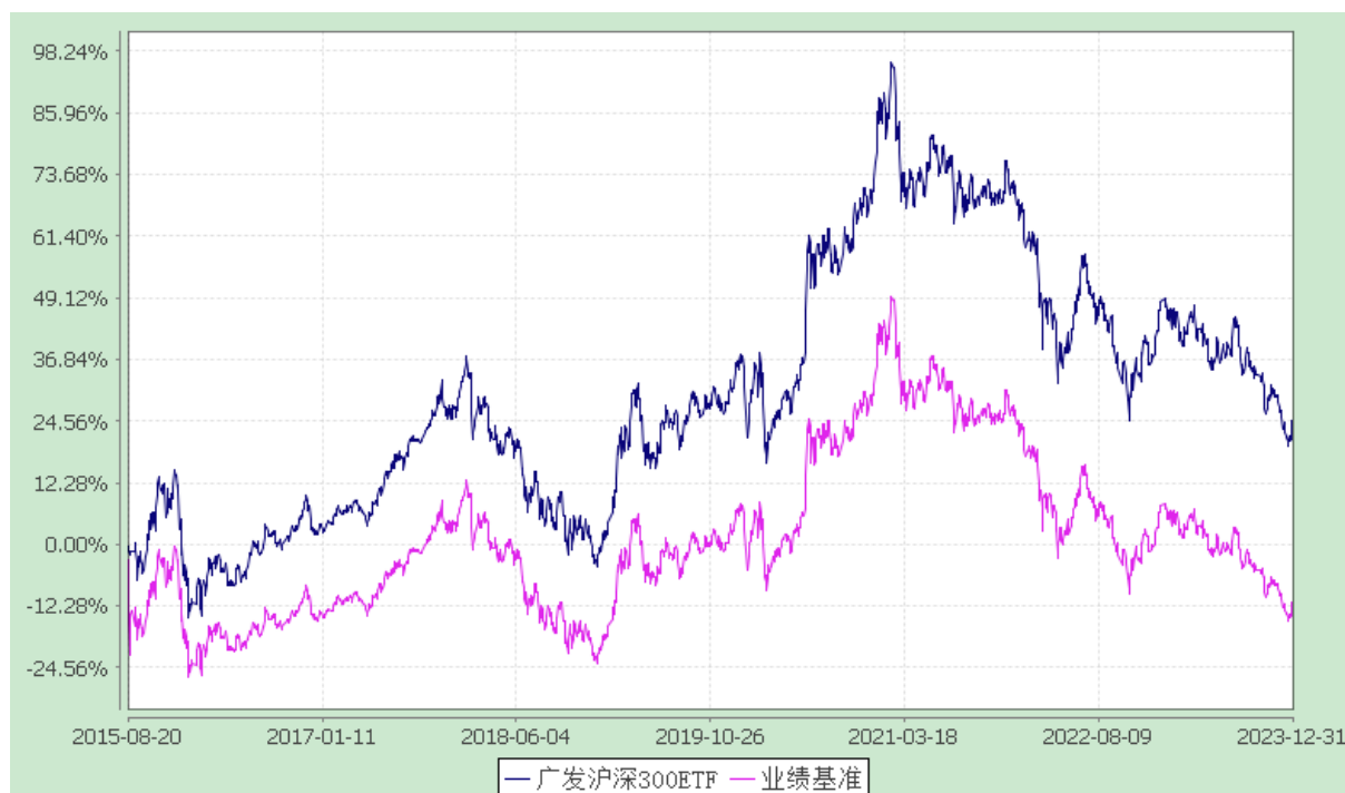
广发沪深 300 交易型开放式指数证券投资基金 份额累计净值增长率与业绩比较基准收益率的历史走势对比图 (2015 年 8 月 20 日至 2023 年 12 月 31 日)