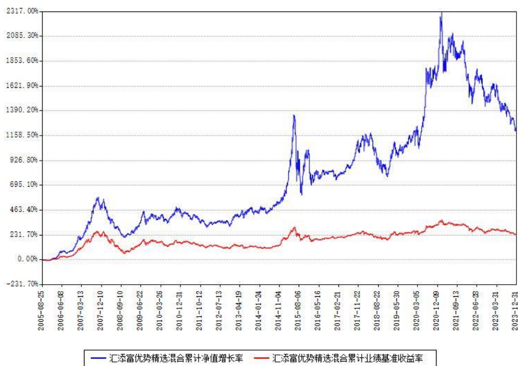
汇添富优势精选混合累计净值增长率与同期业绩比较基准收益率对比图

注：本基金建仓期为本《基金合同》生效之日（2005年08月25日）起6个月，建仓期结束时各项资产配置比例符合合同约定。