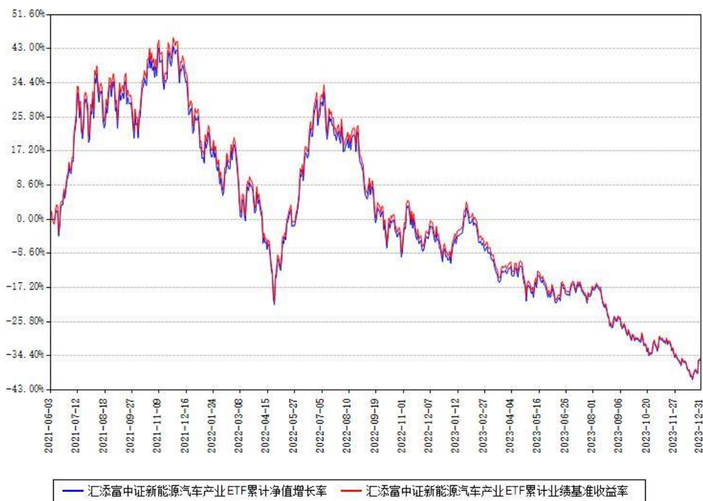
汇添富中证新能源汽车产业ETF累计净值增长率与同期业绩基准收益率对比图

注：本基金建仓期为本《基金合同》生效之日（2021年06月03日）起6个月，建仓期结束时各项资产配置比例符合合同约定。