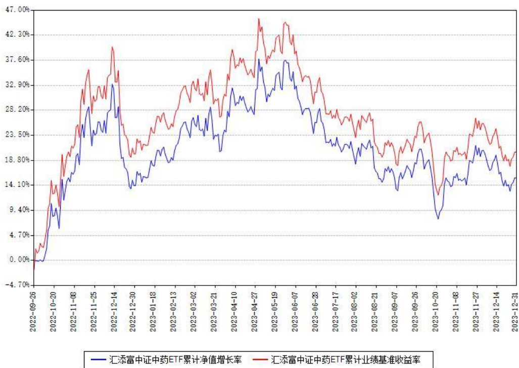
汇添富中证中药ETF累计净值增长率与同期业绩基准收益率对比图

注：本基金建仓期为本《基金合同》生效之日（2022年09月26日）起6个月，建仓期结束时各项资产配置比例符合合同约定。