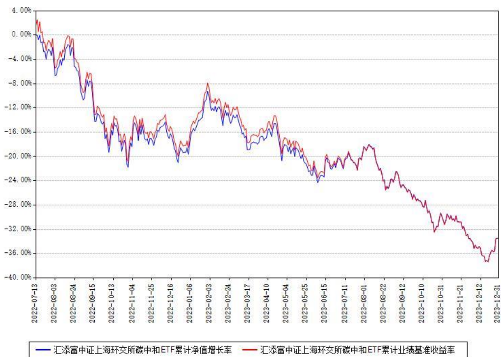
汇添富中证上海环交所碳中和ETF累计净值增长率与同期业绩基准收益率对比图

注：本基金建仓期为本《基金合同》生效之日（2022年07月13日）起6个月，建仓期结束时各项资产配置比例符合合同约定。