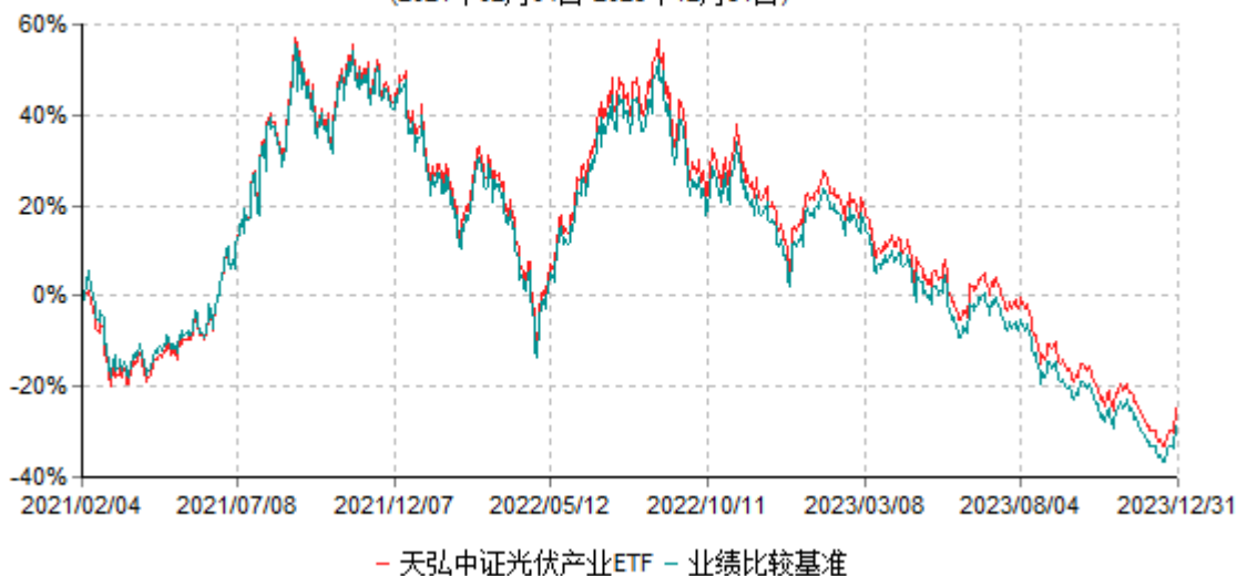
天弘中证光伏产业交易型开放式指数证券投资基金累计净值增长率与业绩比较基准收益率历史走势对比图 (2021年02月04日-2023年12月31日)