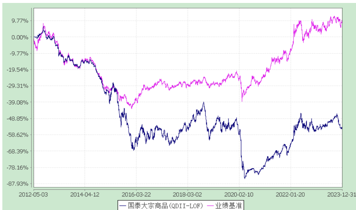
国泰大宗商品配置证券投资基金(LOF) 份额累计净值增长率与业绩比较基准收益率历史走势对比图 (2012年5月3日至2023年12月31日)