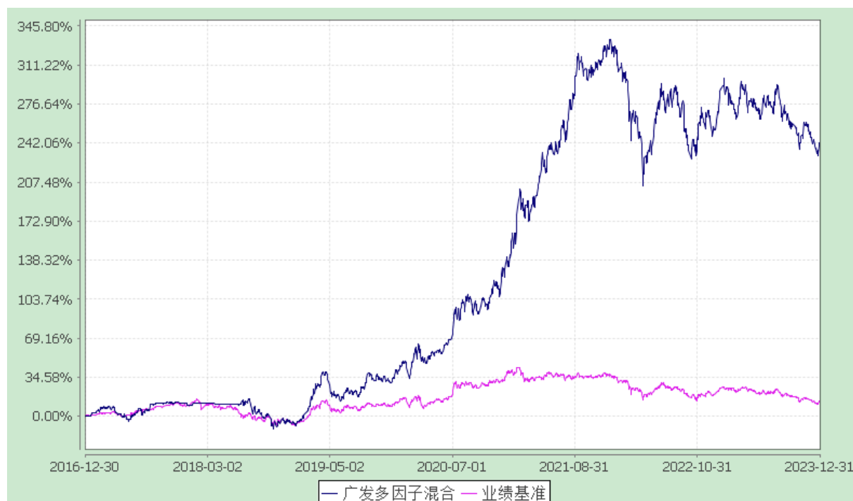
广发多因子灵活配置混合型证券投资基金 份额累计净值增长率与业绩比较基准收益率的历史走势对比图 (2016年12月30日至2023年12月31日)