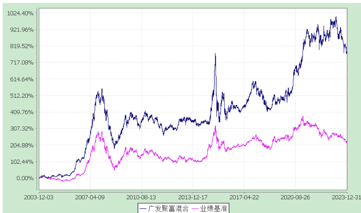
份额累计净值增长率与业绩比较基准收益率的历史走势对比图 (2003 年 12 月 3 日至 2023 年 12 月 31 日)

注：自 2015 年 11 月 2 日起，本基金的业绩比较基准由“中信标普 300 指数收益率×80%+中信标普全债指数收益率×20%”变更为“沪深 300 指数收益率×80%+中证全债指数收益率×20%”。