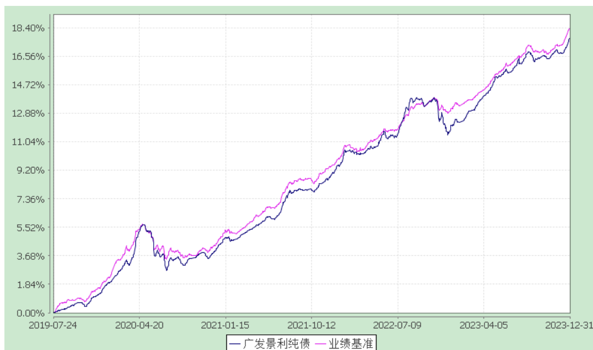
广发景利纯债债券型证券投资基金 份额累计净值增长率与业绩比较基准收益率的历史走势对比图 (2019 年 7 月 24 日至 2023 年 12 月 31 日)