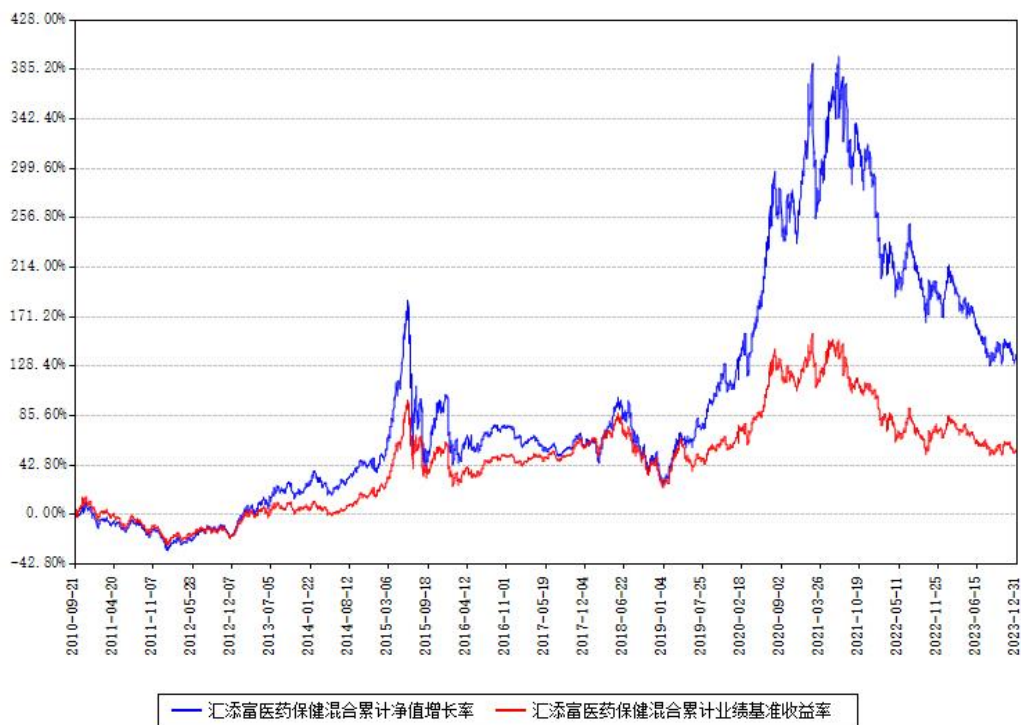
汇添富医药保健混合累计净值增长率与同期业绩基准收益率对比图

注：本基金建仓期为本《基金合同》生效之日（2010年09月21日）起6个月，建仓期结束各项资产配置比例符合合同约定。