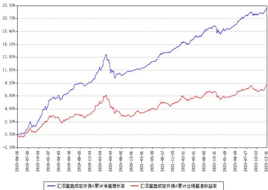
汇添富鑫成定开债A累计净值增长率与同期业绩基准收益率对比图

注：本基金建仓期为本《基金合同》生效之日（2018年04月26日）起6个月，建仓期结束时各项资产配置比例符合合同约定。