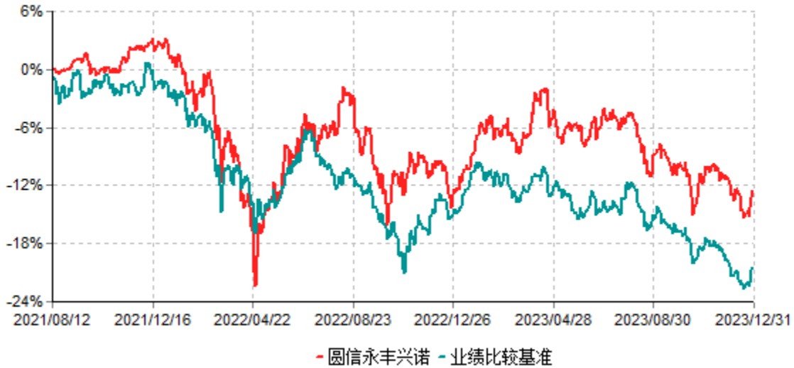
圆信永丰兴诺一年持有期灵活配置混合型证券投资基金累计净值增长率与业绩比较基准收益率历史走势对比图 (2021年08月12日-2023年12月31日)