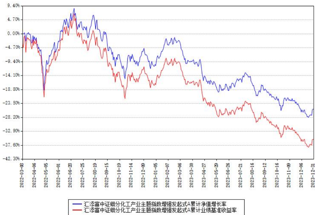
汇添富中证细分化工产业主题指数增强发起式A累计净值增长率与同期业绩基准收益率对比图