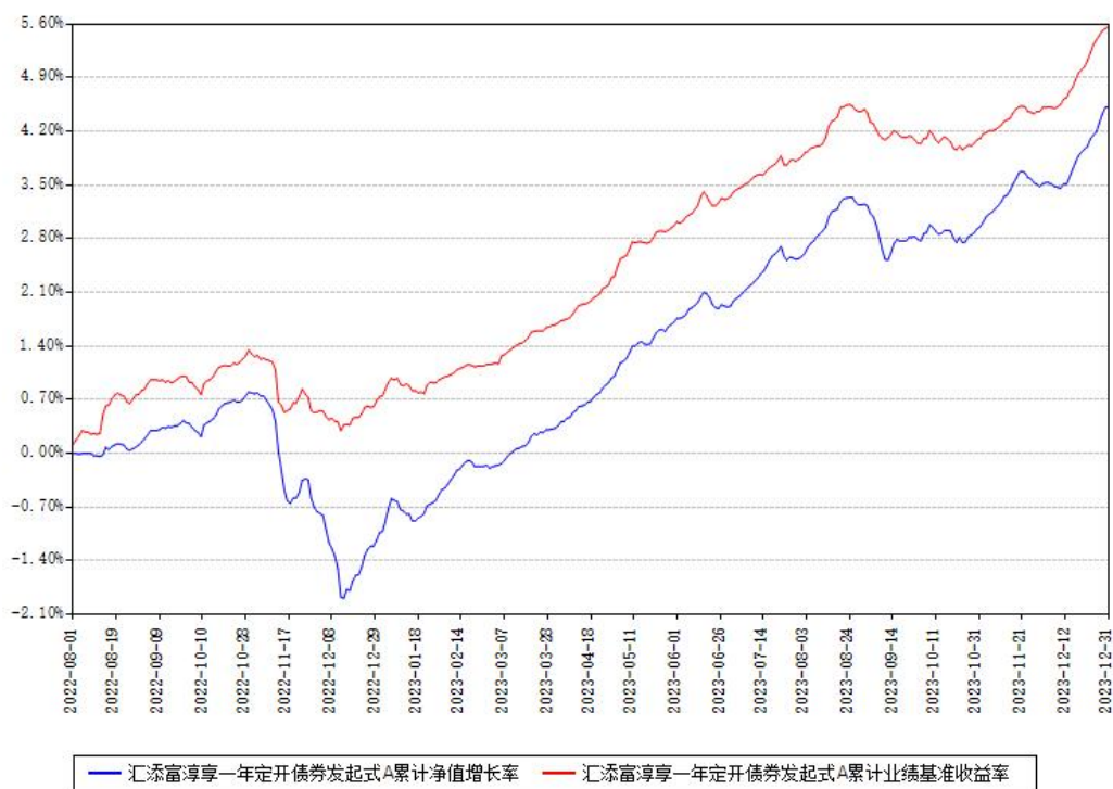
汇添富淳享一年定开债券发起式A累计净值增长率与同期业绩基准收益率对比图

注：本基金建仓期为本《基金合同》生效之日（2022年08月01日）起6个月，建仓期结束时各项资产配置比例符合合同约定。