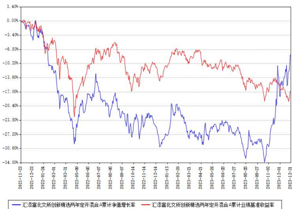
汇添富北交所创新精选两年定开混合A累计净值增长率与同期业绩基准收益率对比图