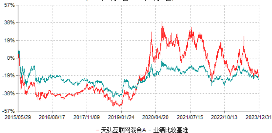
天弘互联网混合A累计净值增长率与业绩比较基准收益率历史走势对比图 (2015年05月29日-2023年12月31日)