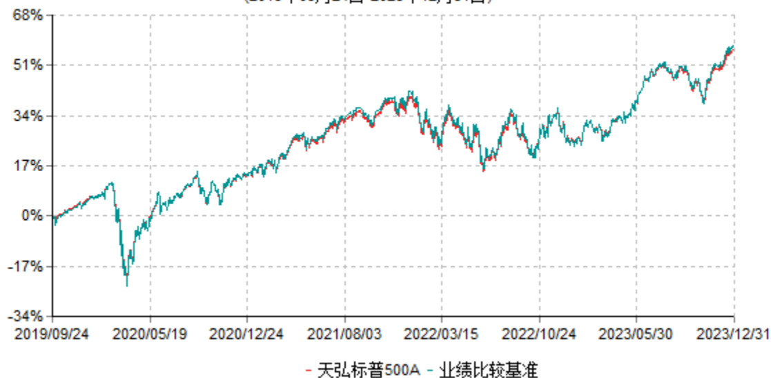
天弘标普500A累计净值增长率与业绩比较基准收益率历史走势对比图 (2019年09月24日-2023年12月31日)