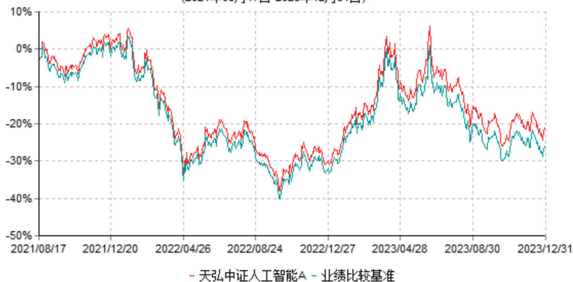
天弘中证人工智能A累计净值增长率与业绩比较基准收益率历史走势对比图 (2021年08月17日-2023年12月31日)