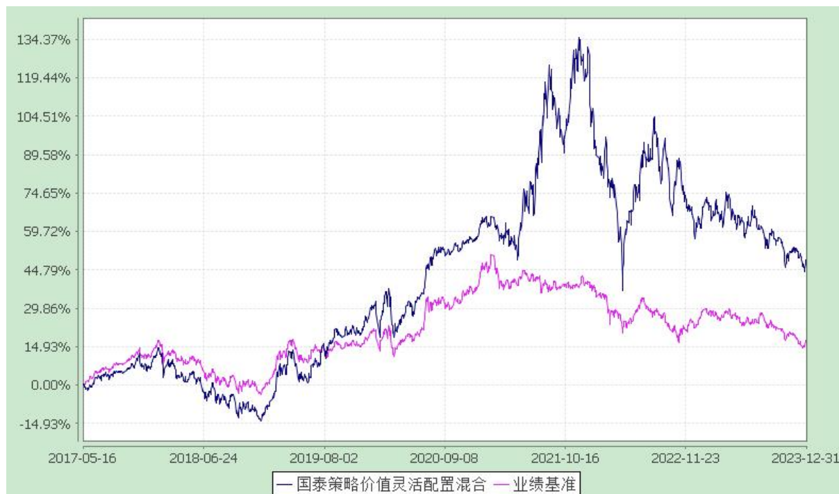
自基金合同生效以来份额累计净值增长率与业绩比较基准收益率的历史走势对比图 (2017 年 5 月 16 日至 2023 年 12 月 31 日)

注：本基金合同生效日为 2017 年 5 月 16 日。本基金在 3 个月建仓结束时，各项资产配置比例符合合同约定。