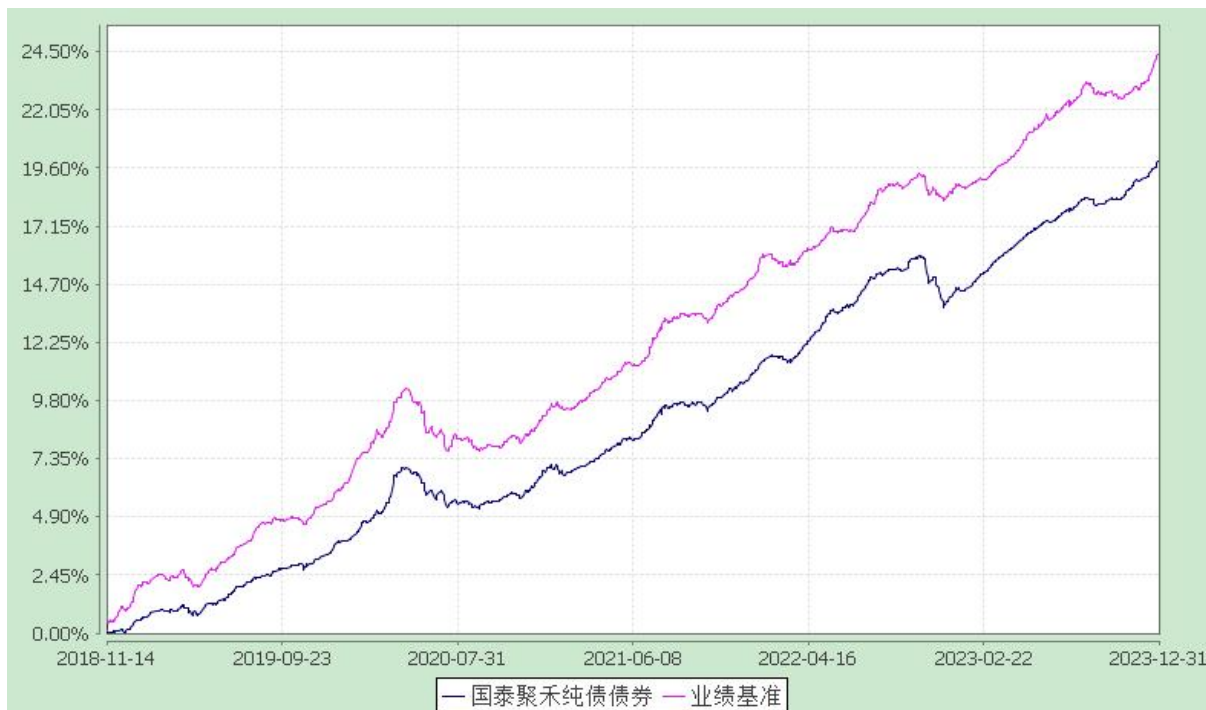
自基金合同生效以来份额累计净值增长率与业绩比较基准收益率的历史走势对比图 (2018 年 11 月 14 日至 2023 年 12 月 31 日)

注：本基金合同生效日为 2018 年 11 月 14 日。本基金在六个月建仓期结束时，各项资产配置比例符合合同约定。