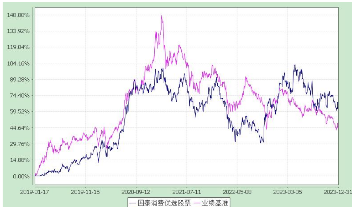
自基金合同生效以来份额累计净值增长率与业绩比较基准收益率的历史走势对比图 (2019 年 1 月 17 日至 2023 年 12 月 31 日)

注：本基金合同生效日为 2019 年 1 月 17 日，本基金的建仓期为 6 个月，在建仓期结束时，各项资产配置比例符合合同约定。