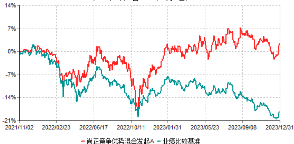
尚正竞争优势混合发起A累计净值增长率与业绩比较基准收益率历史走势对比图 (2021年11月02日-2023年12月31日)