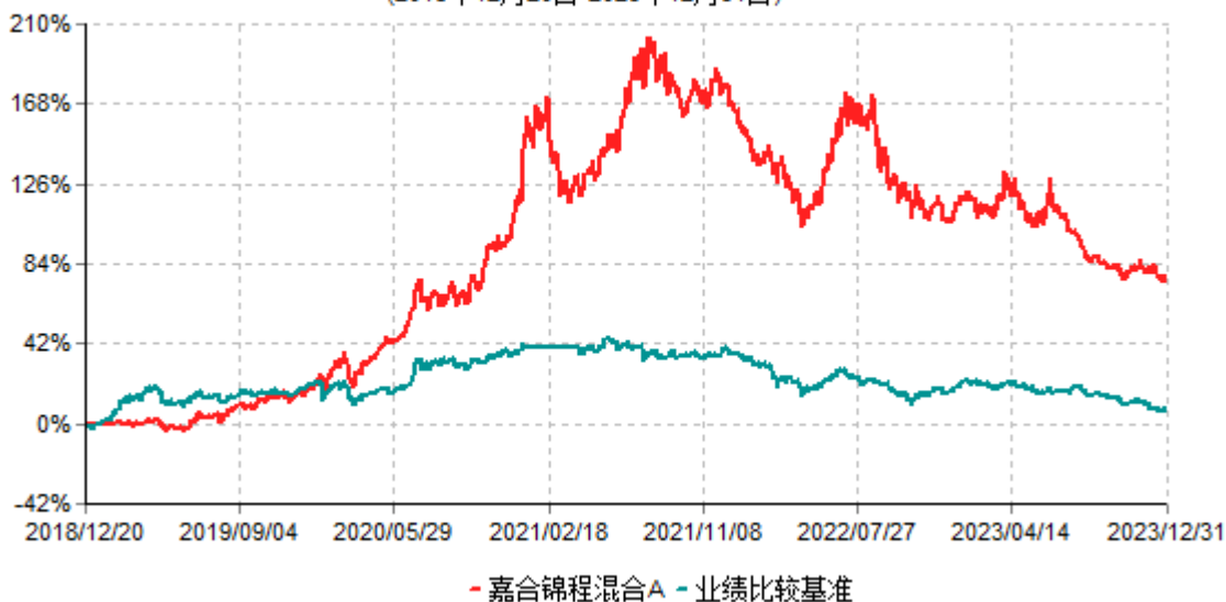
嘉合锦程混合A累计净值增长率与业绩比较基准收益率历史走势对比图 (2018年12月20日-2023年12月31日)