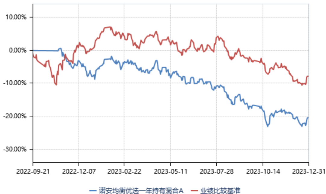
诺安均衡优选一年持有混合 C