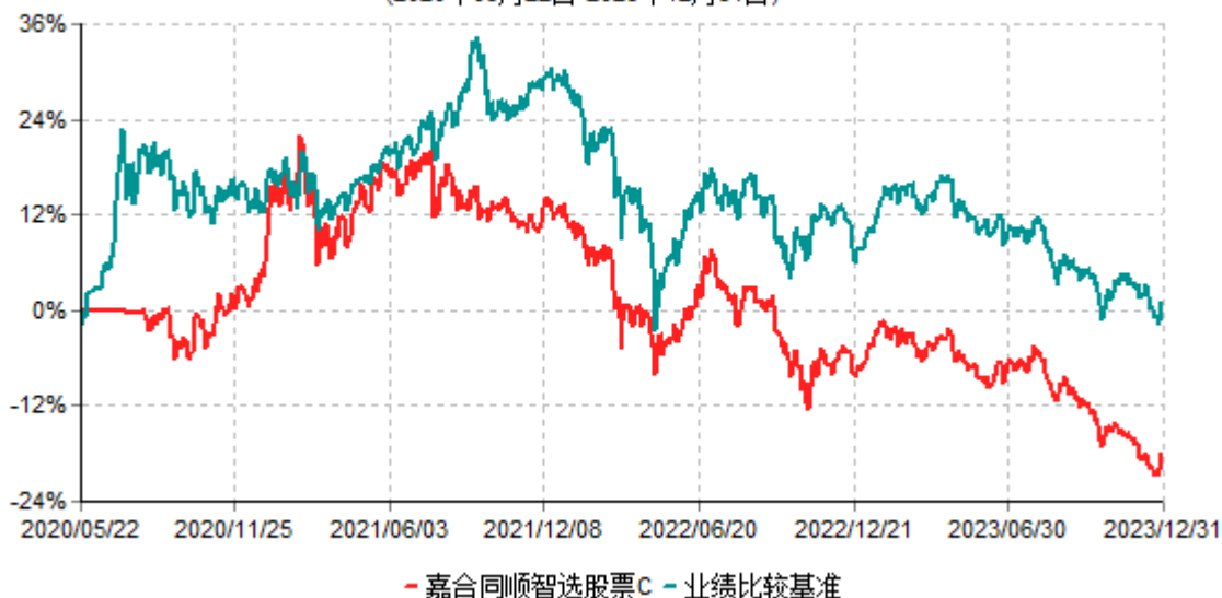
嘉合同顺智选股票C累计净值增长率与业绩比较基准收益率历史走势对比图 (2020年05月22日-2023年12月31日)