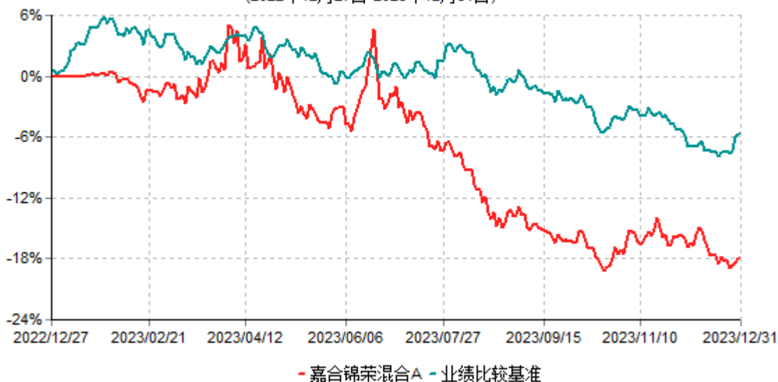
嘉合锦荣混合A累计净值增长率与业绩比较基准收益率历史走势对比图 (2022年12月27日-2023年12月31日)

注：本基金合同于2022年12月27日生效，按基金合同规定，本基金自合同生效起6个月内为建仓期。建仓期结束时，本基金的各项资产配置比例符合基金合同约定。