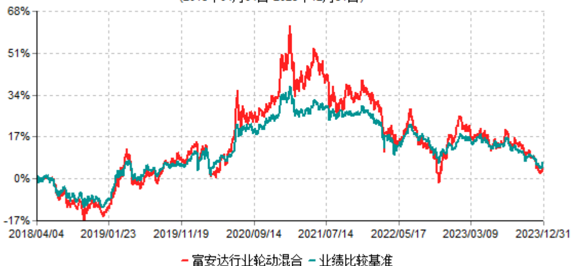
富安达行业轮动灵活配置混合型证券投资基金累计净值增长率与业绩比较基准收益率历史走势对比图 (2018年04月04日-2023年12月31日)