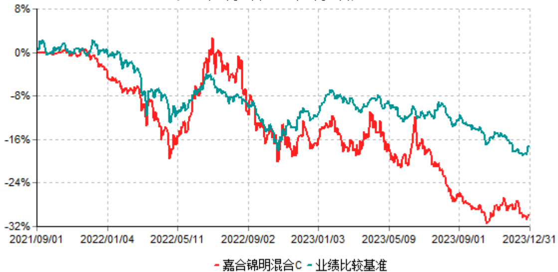
嘉合锦明混合C累计净值增长率与业绩比较基准收益率历史走势对比图 (2021年09月01日-2023年12月31日)