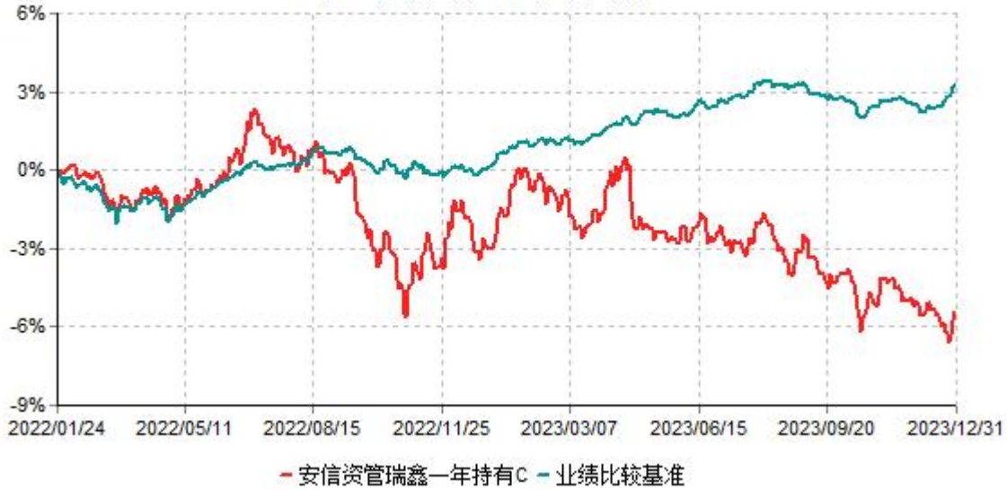
安信资管瑞鑫一年持有C累计净值增长率与业绩比较基准收益率历史走势对比图 (2022年01月24日-2023年12月31日)

注：安信资管瑞鑫一年持有C（970079）1月21日尚未开放申赎，无计划份额，2022年1月21日净值不进行披露。