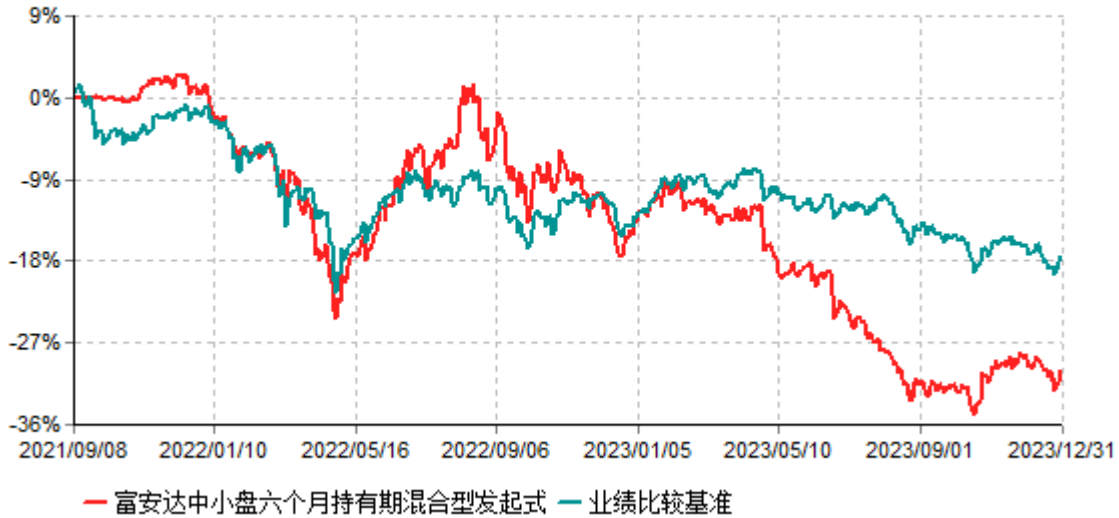
富安达中小盘六个月持有期混合型发起式证券投资基金累计净值增长率与业绩比较基准收益率历史走势对比图 (2021年09月08日-2023年12月31日)