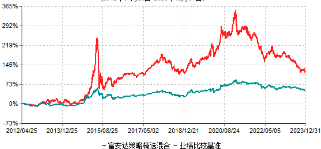
富安达策略精选灵活配置混合型证券投资基金累计净值增长率与业绩比较基准收益率历史走势对比图 (2012年04月25日-2023年12月31日)