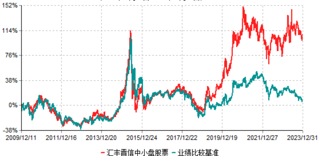
汇丰晋信中小盘股票型证券投资基金累计净值增长率与业绩比较基准收益率历史走势对比图 (2009年12月11日-2023年12月31日)

注：1. 按照基金合同的约定，本基金的股票投资比例范围为基金资产的85%-95%，其中，将不低于80%的股票资产投资于国内A股市场上具有良好成长性和基本面良好的中小上市公司股票。本基金权证投资比例范围为基金资产净值的0%-3%。本基金固定收益类证券和现金投资比例范围为基金资产的5%-15%，其中现金（不包括结算备付金、存出保证金、应收申购款等）或到期日在一年以内的政府债券的投资比例不低于基金资产净值的5%。按照基金合同的约定，本基金自基金合同生效日起不超过6个月内完成建仓，截止2010年6月11日，本基金的各项投资比例已达到基金合同约定的比例。