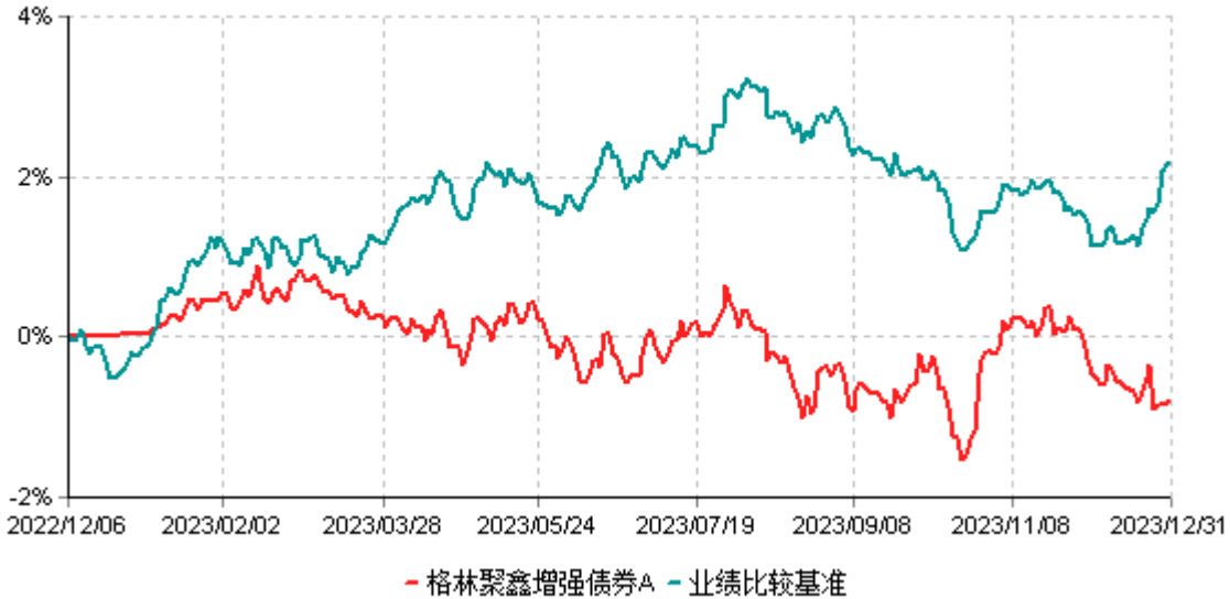
格林聚鑫增强债券A累计净值增长率与业绩比较基准收益率历史走势对比图 (2022年12月06日-2023年12月31日)