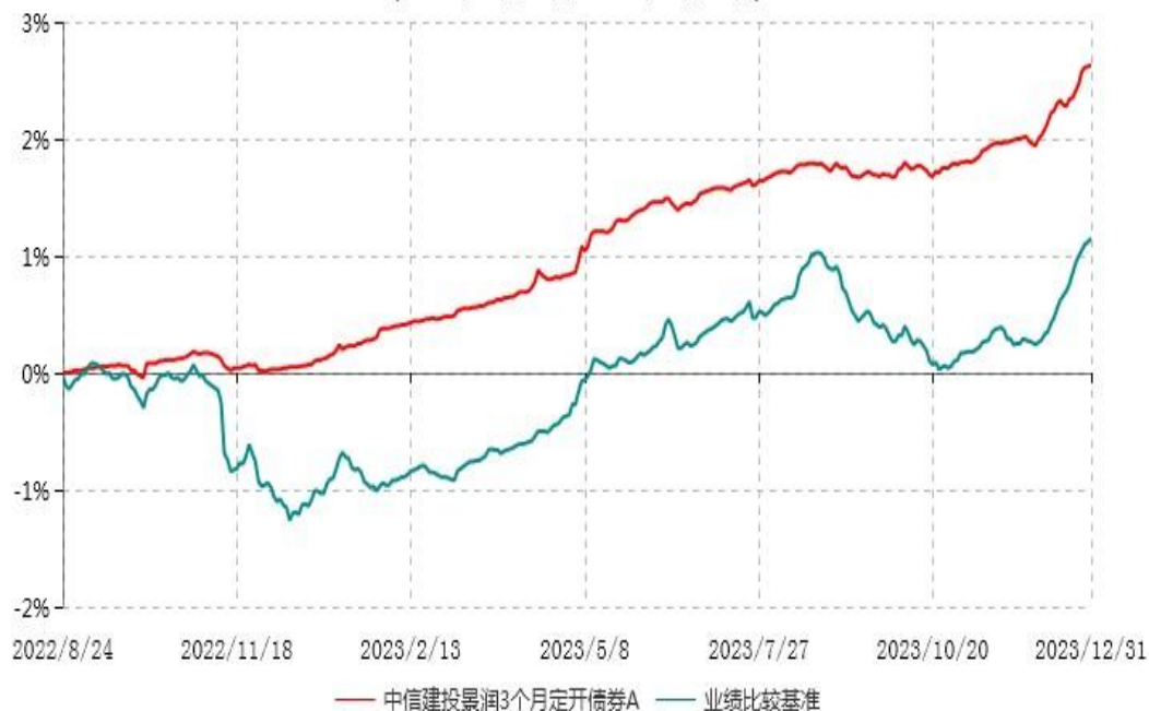
中信建投景润3个月定开债券A累计净值增长率与业绩比较基准收益率历史走势对比图 (2022年08月24日-2023年12月31日)